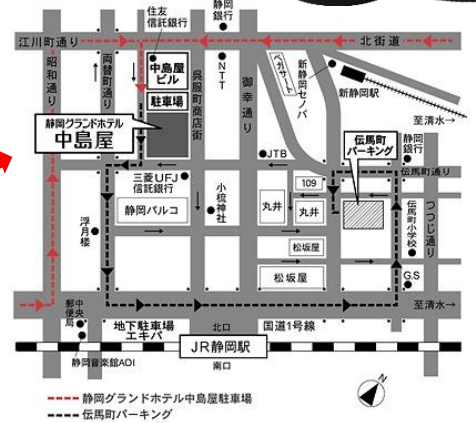
JR静岡駅北口より徒歩5分です

9月5日(水) 時間: 13時~17時 場所: 静岡県静岡市葵区紺屋町3-10 静岡グランドホテル中島屋3F 「ライラックII」 会費: 無料 酒販店様・飲食店様等業界関係者のみの試飲会となります。